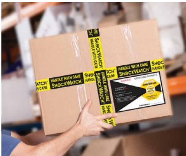
Στη φωτογραφία το ShockWatch 2 με συνοδευτική ετικέτα και ταινία.